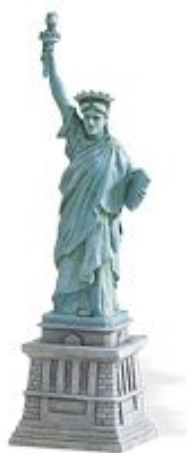
Estatua de la Libertad