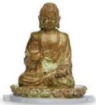
Buda de Lantau

El _____ Tian Tan, más conocido como Buda Gigante, es una estatua gigante de bronce de un buda ubicado en la Isla de Lantau, en Hong Kong, adyacente al Monasterio de Po Lin.