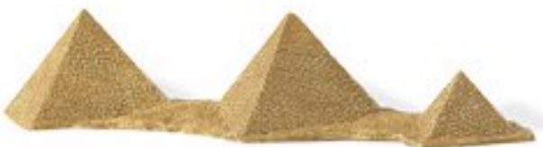
Pirámides de Giza

Las _____ se denominan de mayor a menor Keops, Kefrén y Mecerinos. Están situadas a unos 20 kilómetros al sudoeste del centro de El Cairo