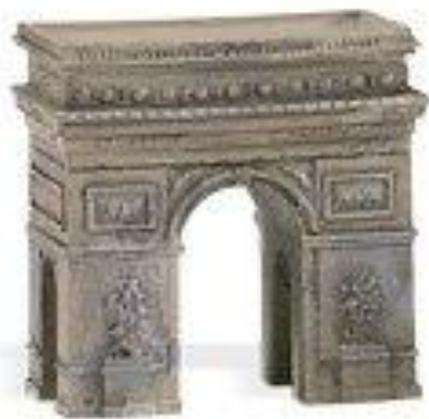
Arco del Triunfo

El Arco de Triunfo de París es uno de los monumentos más famosos de la capital francesa y probablemente se trate del arco de triunfo más célebre del mundo.