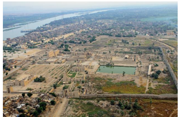
Necrópolis de Karnak