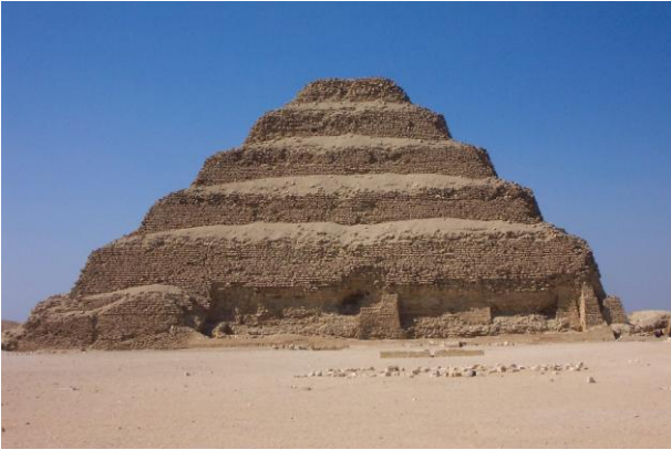
Pirámide de Zoser