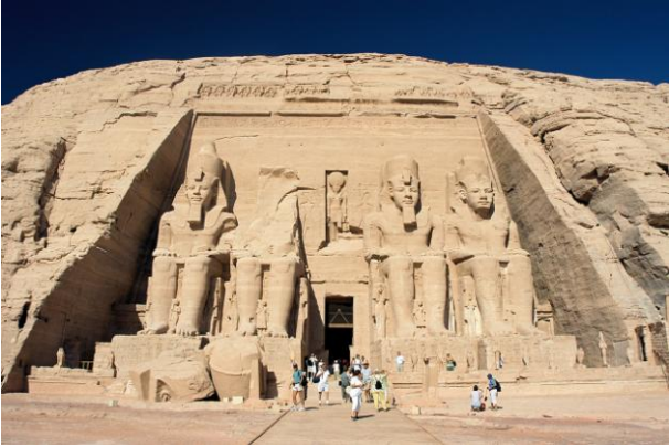
Templo de Abu Simbel