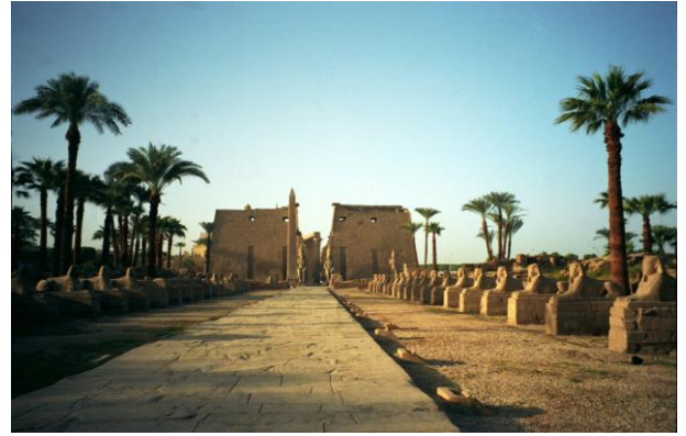
Templo de Luxor