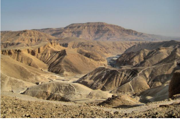
Valle de los reyes