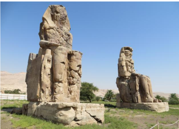
Colosos de Memnon