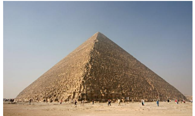
Gran pirámide de Guiza