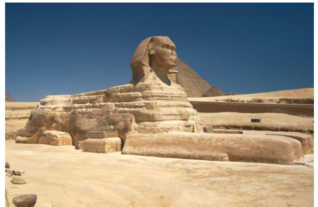
Gran Esfinge de Guiza