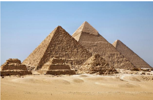
Necrópolis de Guiza