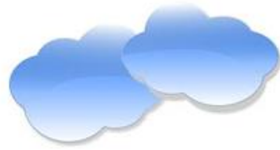
Formación de Nubes